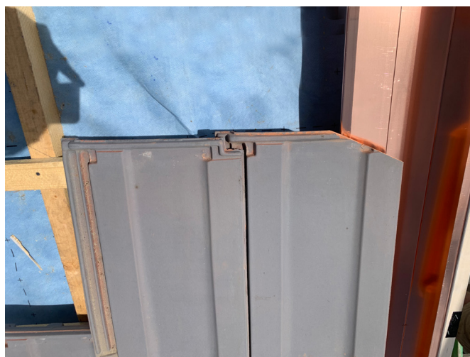
Seitlicher Anschluss bei geschuppten Deckmaterialien mit Seitenblech und gestutztem Ecken

Grundsätzlich sollte das Deckmaterial am Anschluss verdeckt gestutzt werden, damit weniger Schmutz haften bleibt und das Wasser schlechter anziehen kann.