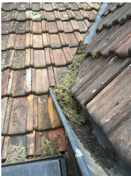
Stark verschmutzte Kehle, wo das Wasser nicht mehr wunschgemäß abfließen kann.