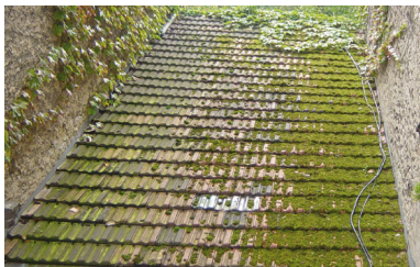
Vor der Oberflächenreinigung