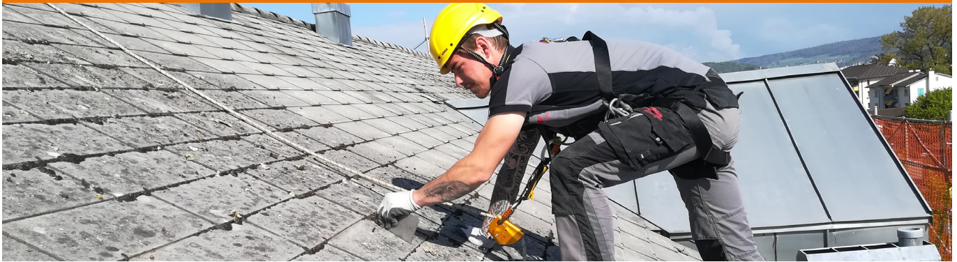
Reinigung von Plattenfugen bei nicht asbesthaltigem Faserzement