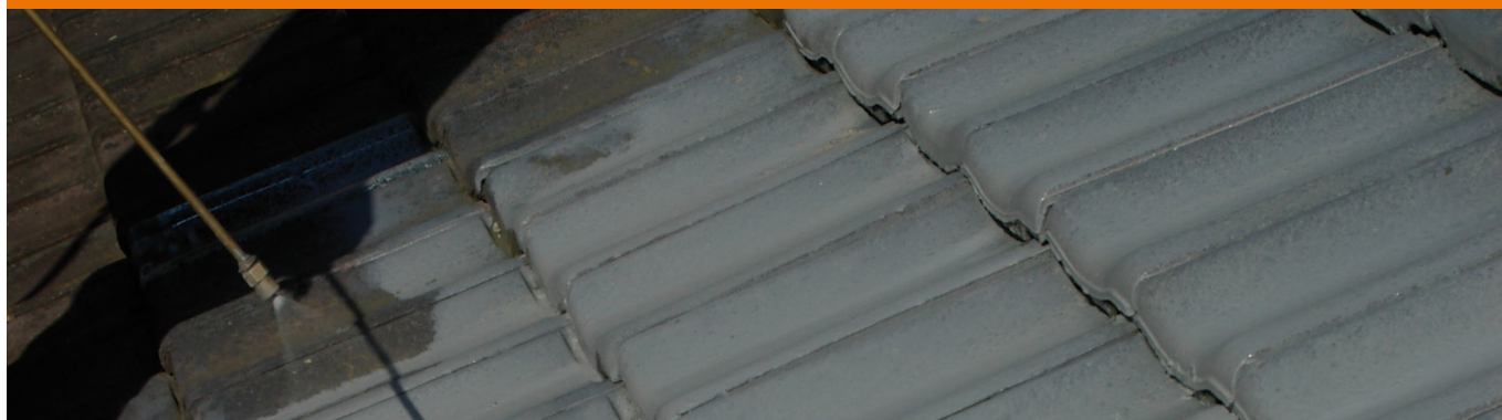
Aufspritzen der Dachbeschichtung