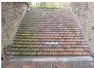
Nach der Oberflächenreinigung