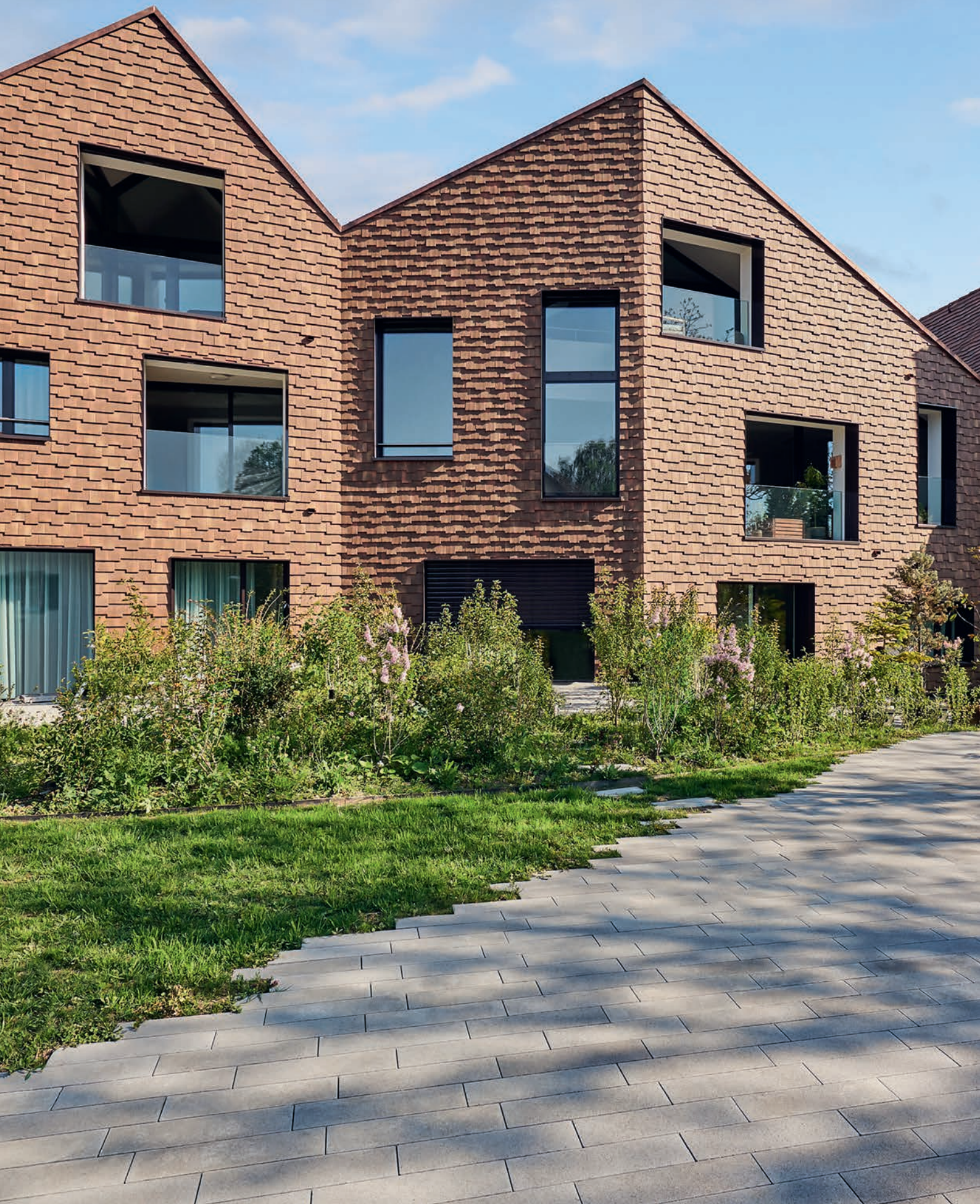
Blickfang der besonderen Art: Mehrfamilienhaus in Uerikon in Biberkleid.