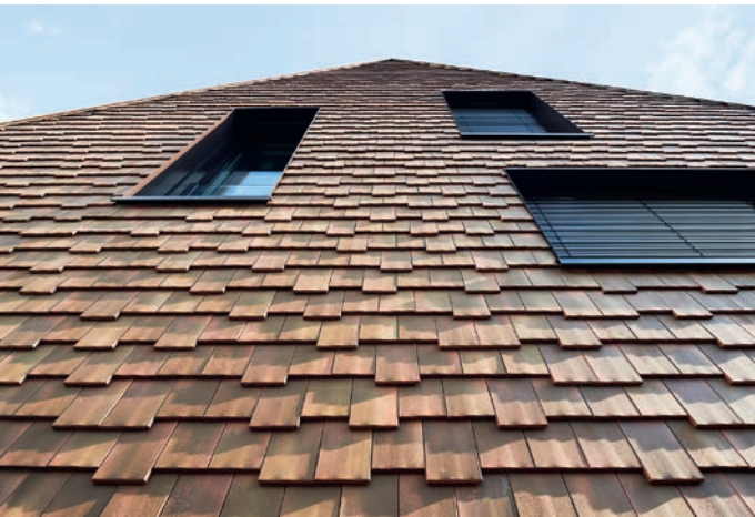
Tondachziegel so weit das Auge reicht.